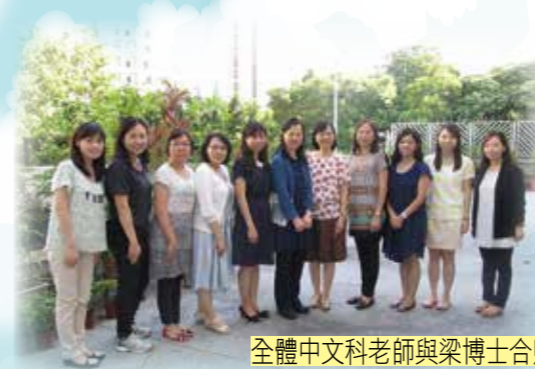
全體中文科老師與梁博士合照

本校與教育局·校本支援服務處·小學校本課程發展組分三個階段進行協作教學，至今剛好三年。透過與各級中文科老師進行同儕備課，優化寫作教學；同時審視學生的學習表現及學習難點，檢視及修訂現有課程規劃，優化校本中文科縱向課程，讓學生能循序漸進，全面而均衡地學習中國語文。