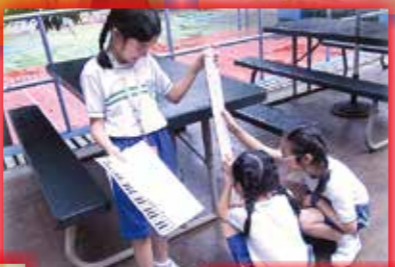
三年級：桌子有多高

本活動旨在為學生提供多元化學習經歷，讓其運用協作能力、溝通能力及運算能力解決數學問題。活動當天，於校園內設置不同的主題活動，學生以小組形式完成指定的任務。