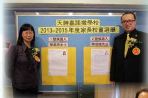
兩位家長校董合照

學校按照教育局及辦學團體的指引，由2013年初開始準備過渡工作，當中包括選出教員校董，及清楚界定所有資產及資金之擁有權及資金的提供者(如政府、辦學團體或捐贈機構)，故此學校已於2013年9月16日為所有資產進行全面盤點。